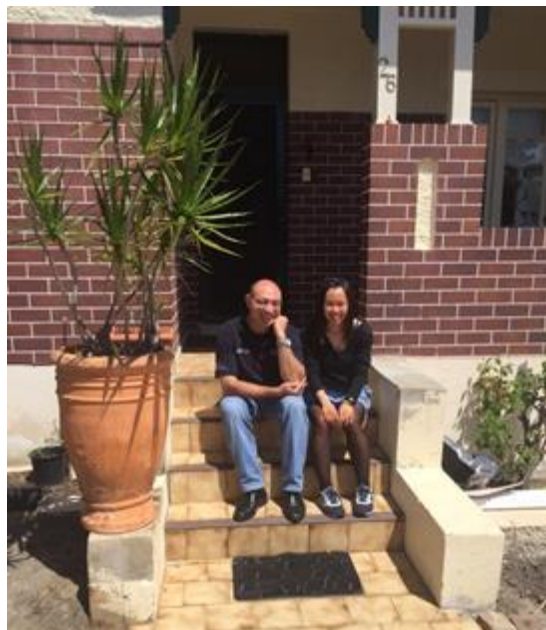
女子のホームステイ先

まだ、サッカースクールへは行っていませんが、これから2週間頑張ります。 富岡高校の皆さんも頑張ってください。