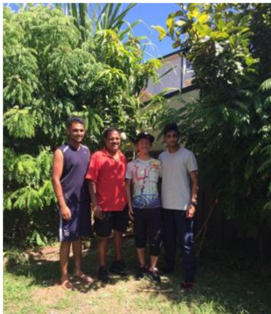
男子2名のホームステイ先